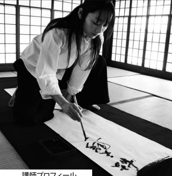
講師プロフィール